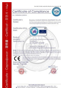
Certificat de conformité CE Taille du fichier: 108 Ko