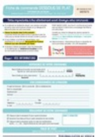
Fiche de commande Taille du fichier: 770 Ko