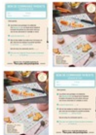
Bon de commande Parents Taille du fichier: 387 Ko