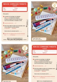
Bon de commande Parents Plumier Taille du fichier: 554 Ko