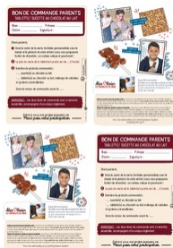
Bon de commande Parents Tablettes de chocolat Taille du fichier: 1,2 Mo