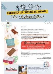
Taille du fichier: 1,1 Mo