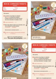
Bon de commande Parents Plumier Taille du fichier: 554 Ko