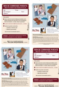
Taille du fichier: 1,2 Mo