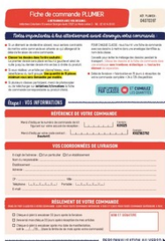
Fiche de commande Plumier Taille du fichier: 956 Ko