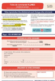
Fiche de commande Plumier Taille du fichier: 956 Ko