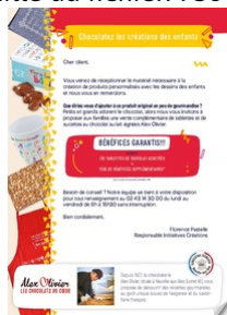
Fiche de commande Tablettes de chocolat Taille du fichier: 1,6 Mo