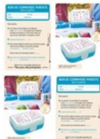
Bon de commande Parents Taille du fichier: 589 Ko