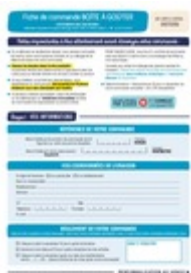
Fiche de commande Taille du fichier: 958 Ko