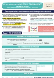
Fiche de commande Taille du fichier: 986 Ko