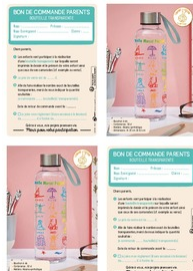
Bon de commande Parents Taille du fichier: 782 Ko