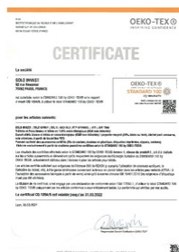
certificat oeko tex Taille du fichier: 68 Ko