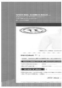
bon de commande textile Taille du fichier: 18,6 Mo