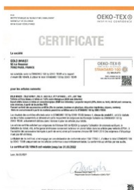
certificat oeko tex Taille du fichier: 68 Ko