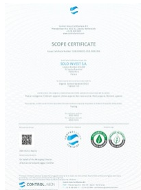
certificat organic 100 Taille du fichier: 722 Ko