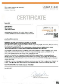
certificat oeko tex Taille du fichier: 68 Ko