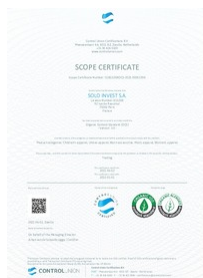
certificat organic 100 Taille du fichier: 722 Ko