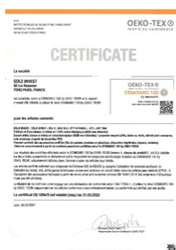
certificat oeko tex Taille du fichier: 68 Ko