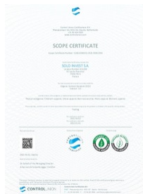
certificat organic 100 Taille du fichier: 722 Ko