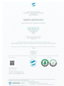
certificat organic 100 Taille du fichier: 722 Ko