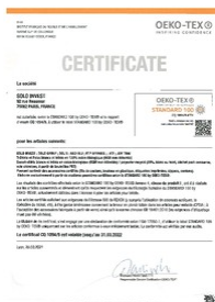
certificat oeko tex Taille du fichier: 68 Ko