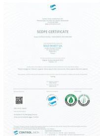
certificat organic 100 Taille du fichier: 722 Ko