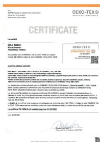
certificat oeko tex Taille du fichier: 68 Ko