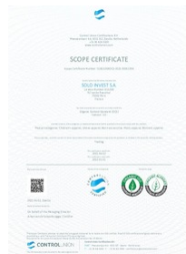
certificat organic 100 Taille du fichier: 722 Ko