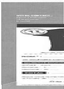
bon de commande tee shirt noir