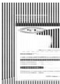
bon de commande polo respirant rouge Taille du fichier: 19 Mo