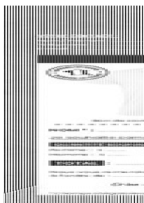
bon de commande polo respirant blanc Taille du fichier: 18,9 Mo