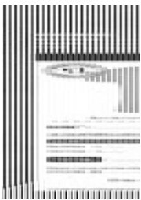
bon de commande polo respirant gris Taille du fichier: 18,9 Mo