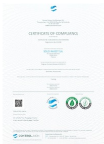
certificat Organic100 Taille du fichier: 720 Ko