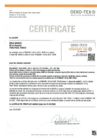
certificat oeko tex Taille du fichier: 68 Ko