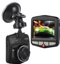
Caméra embarquée de voiture QUANTITÉ: 1 PIÈCE