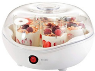
Yaourtière QUANTITÉ: 1 PIÈCE