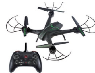
Drone Wifi-Fi avec caméra QUANTITÉ: 1 PIÈCE