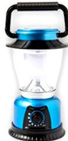
Lampe de camping QUANTITÉ: 2 PIÈCES