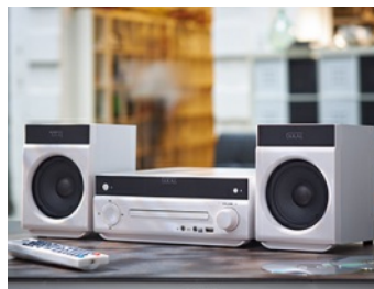
Micro-chaîne Bluetooth Akai QUANTITÉ: 1 PIÈCE