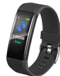
Montre connectée QUANTITÉ: 1 PIÈCE