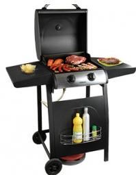
Barbecue à Gaz 2 feux QUANTITÉ: 1 PIÈCE