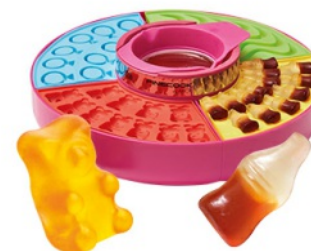
Machine à bonbons QUANTITÉ: 2 PIÈCES