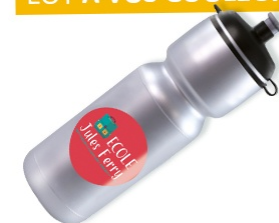
Gourde personnalisée QUANTITÉ: 40 PIÈCES