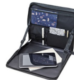
Organiseur de voiture QUANTITÉ: 20 PIÈCES