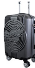
Valise QUANTITÉ: 1 PIÈCE