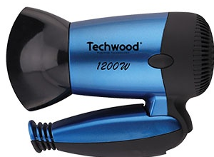
Sèche-cheveux de voyage QUANTITÉ: 1 PIÈCE