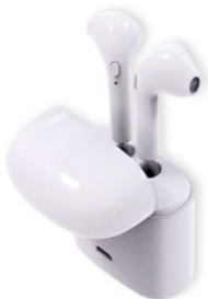
Set écouteurs Bluetooth QUANTITÉ: 1 PIÈCE