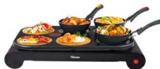
Appareil à plancha-wok QUANTITÉ: 1 PIÈCE