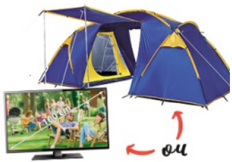
Tente (4 personnes) OU TV 100 cm QUANTITÉ: 1 PIÈCE