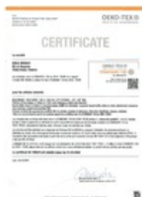
certificat oeko tex Taille du fichier: 68 Ko