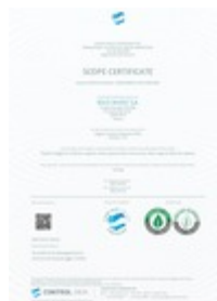
certificat organic 100 Taille du fichier: 722 Ko