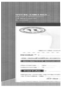
bon de commande textile Taille du fichier: 19,1 Mo