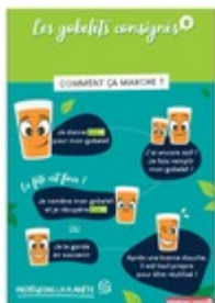
Affiche gobelet consigné