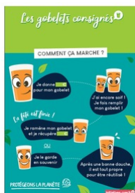
Affiche gobelet consigné Taille du fichier: 663 Ko